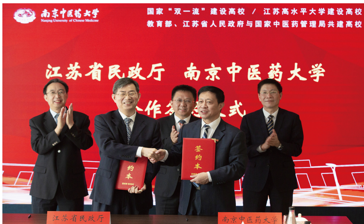
合作签约仪式现场

10月30日，我校与江苏省民政厅合作共建养老服务与管理学院协议签订仪式在汉中门校区举行。副省长赵世勇，省政府副秘书长诸纪录，省教育厅厅长葛道凯，省民政厅厅长吕德明，校长胡刚，副校长程海波、乔学斌、徐桂华、曾莉，省政府及有关部门领导、我校相关职能部门负责人出席签约仪式。签约仪式由省民政厅副厅长沙维伟主持。