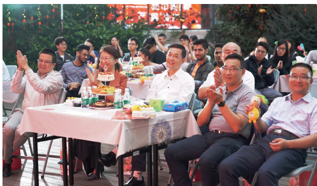
文化交流活动现场

为进一步促进中外文化交流，由国际教育学院（台港澳教育中心）和公共外语教学部联合主办的“情满中秋，共度‘家’节”——中外学生文化交流暨文杏讲堂活动在学校国际教育中心举行。副校长孙志广，学生工作处、团委、各学院的领导老师与来自十几个国家、地区的中外学生齐聚一堂参加此次活动。本次活动采取线上线下相结合的形式进行，因疫情防控无法返校共度佳节的境外学生及海外校友通过在线直播共同感受节日气氛。