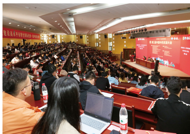
第三届中国中药资源大会现场

10月17日至18日，值药学院60周年院庆之际，第三届中国中药资源大会在我校仙林校区丰盛楼报告厅举行。大会由中国自然资源学会中药及天然药物资源研究专业委员会等中药资源领域12家学术团体联合发起主办，南京中医药大学、江苏省中药资源产业化过程协同创新中心承办。此次大会以“中药资源与产业高质量发展”为主题，通过线上、线下同步召开，220余名参会代表出席线下大会，来自全国中药资源领域2000余名代表注册观看大会直播。