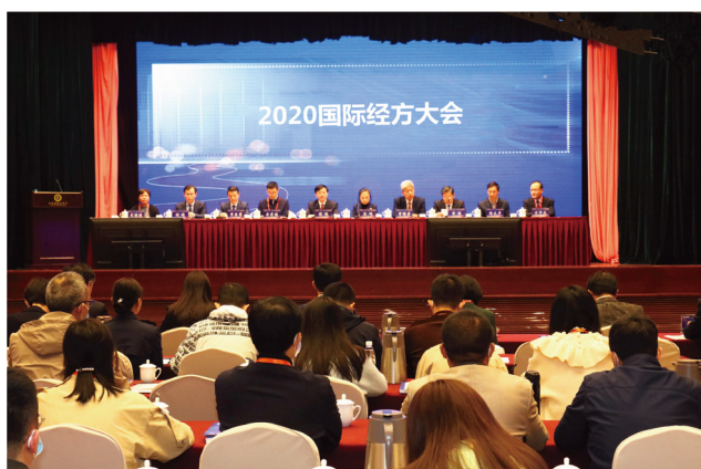
国际经方大会现场

大会于2020年10月16日-18日在南京举行。本次大会是一场全球性的经方学术盛会，大会以“经方传承与国际化”为主题，通过线上、线下同步召开，来自江苏的180余名参会代表参加线下会议，来自全球多个国家和地区的4000余名经方学者、经方爱好者注册线上参会，24000余人观看大会线上直播。