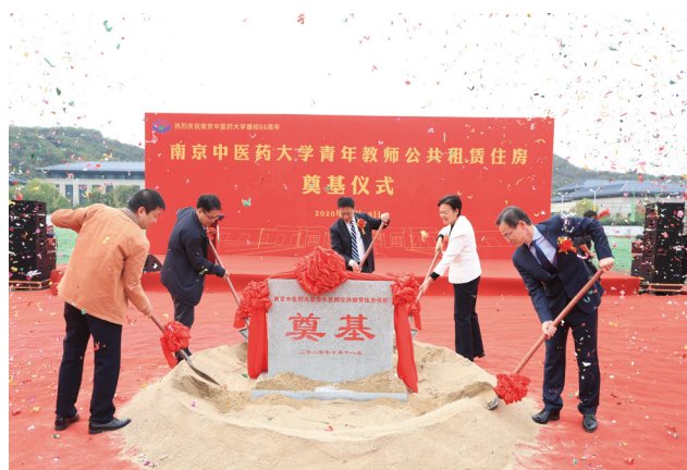
与会领导和嘉宾为青年教师公共租赁住房奠基

职工住房压力，提升我校青年教职工的幸福 感、获得感、安全感，为青年才俊扎根南中 医、奉献南中医提供坚实保障，必将对推进 “强富美高”南中医建设，推动学校事业高 质量发展产生深远影响。胡刚希望，参建各 方要严格执行合同，高标准要求、高质量管 理、高效能运作，保质、保量、保安全，确 保工程如期完工；校内相关部门要与参建各 方密切合作、加强统筹、做好保障，各方共 同努力把“青租房”建设成为精品工程、暖 心工程，为美丽的南中医校园再添靓丽风 景、交出满意答卷。